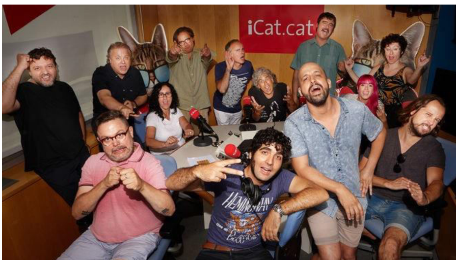
Figura 3: iCAT emetrà en FM a partir de la temporada 2017-18

Gordillo: iCAT va ser una revolució el 2006, fa més deu anys. Quan es va crear no existia Spotify. No hi havia l'entorn d'àudio a la carta de ràdios per Internet d'avui. En el seu moment va rebre nombrosos reconeixements, nacionals i internacionals. Va crear-se com un portal de canals de músiques especialitzades. Però responent a la teva