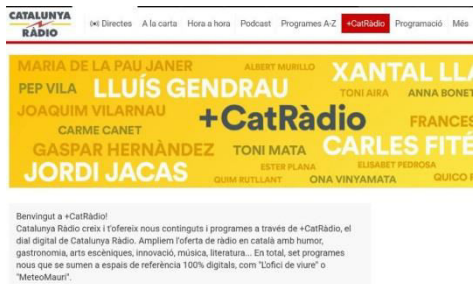
Figura 2: +CatRàdio