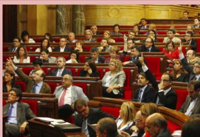
Moment de les votacions sobre el pacte fiscal en el ple del Parlament el 25 de juliol del 2012.

El 25 de juliol del 2012, el Parlament de Catalunya va aprovar el pacte fiscal amb els vots a favor de CiU, ICV-EUiA, ERC i del diputat no adscrit, Joan Laporta, amb les abstencions del PSC (que va votar en contra de l'agència tributària pròpia, tret del diputat socialista Ernest Maragall) i del PPC (que també va votar en contra de l'agència tributària pròpia) i els vots en contra de Ciutadans i Solidaritat en la totalitat del projecte. El pacte