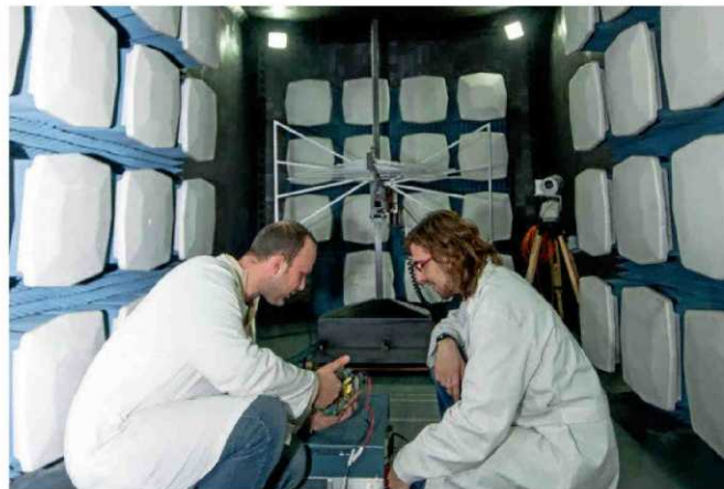
UNIVERSIDAD DE ALCALÁ DE HENARES

En el próximo curso académico, la Universidad de Lérida presentará tres nuevos grados: en Diseño Digital y Tecnologías Creativas, Ingeniería Química, Técnicas de Interacción Digital y de Computación. Su punto fuerte es el estudio de la agroalimentación al ser referente mundial en Tecnología de los Alimentos. PUESTO EN EL RÁNKING GENERAL: 28º