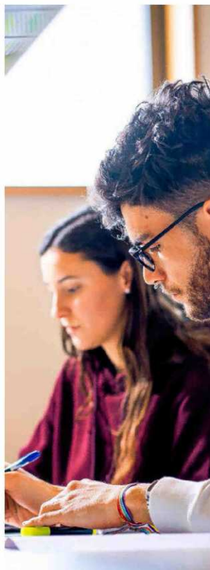
UNIVERSIDAD CARLOS III

Se puede cursar el 50% de los créditos de la titulación en inglés, que se incluirá en el Suplemento Europeo al Título. Ofrece 120 plazas.