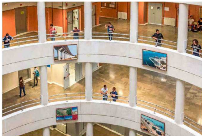
UNIVERSIDAD DE GRANADA

La UGR es el destino preferido por los estudiantes europeos para realizar un intercambio (LLP/Erasmus): el 10% de sus alumnos son internacionales. Para fomentar esta movilidad, participa en más de 800 acuerdos de intercambios bilaterales y multilaterales con instituciones de educación superior de todo el mundo. PUESTO EN EL RÁNKING GENERAL: 11º