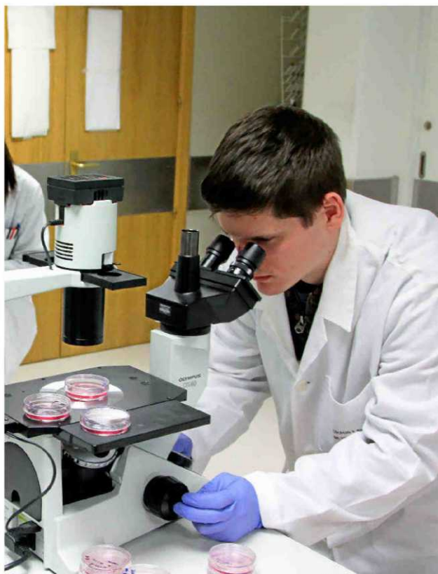
UNIVERSIDAD FRANCISCO DE VITORIA

Desde el primero año sus alumnos cursan la asignatura Integrated Laboratory en la que aplican los conceptos teóricos aprendidos.