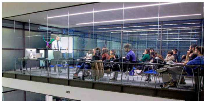
UNIVERSIDAD RAMÓN LLULL

Por titulaciones, Medicina es la preferida. Para una oferta de 5.660 plazas, se recibieron 45.188 preinscripciones en primera instancia. La segunda más requerida es la titulación de Veterinaria, con una demanda de 7.006 matriculas para una oferta de 1.113. Le sigue Enfermería que tuvo 23.405 solicitudes para tan sólo 9.314 puestos disponibles. Los grados de Psicología, Educación Infantil, Educación Primaria, Derecho y ADE a nivel nacional se encuentran también entre los más demandados. En el lado opuesto, la titulación de Arquitectura continúa siendo, un año más, la carrera universitaria menos elegida por los estudiantes.