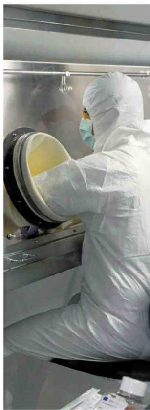
UNIVERSIDAD DE BARCELONA

Los alumnos pueden realizar 12 créditos de prácticas externas aprobando dos asignaturas: una obligatoria y otra optativa de 6 ECTS.