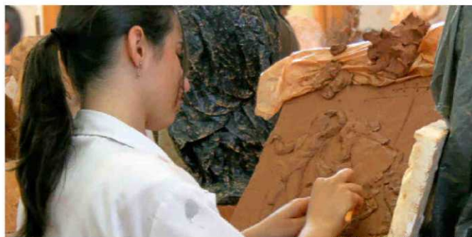
UNIVERSIDAD COMPLUTENSE DE MADRID