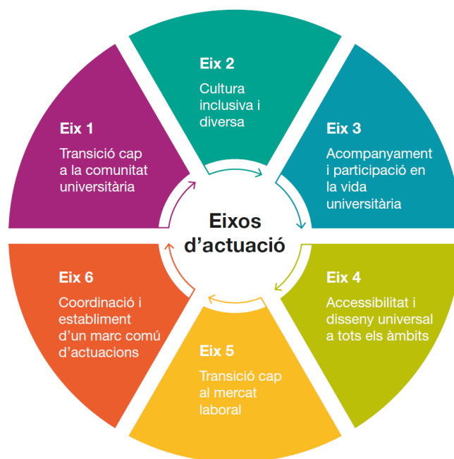
Figura 2. Eixos d'actuació del Pla de Diversitat (Font: PIDUC)

Per a cada acció proposada, s'especifica el col·lectiu al qual s'adreça, el responsable de la seva execució i el calendari previst per a la seva implementació. Aquesta metodologia assegura un seguiment eficient i una assignació clara de responsabilitats, elements fonamentals per transformar la diversitat en una realitat tangible i efectiva a la Universitat.