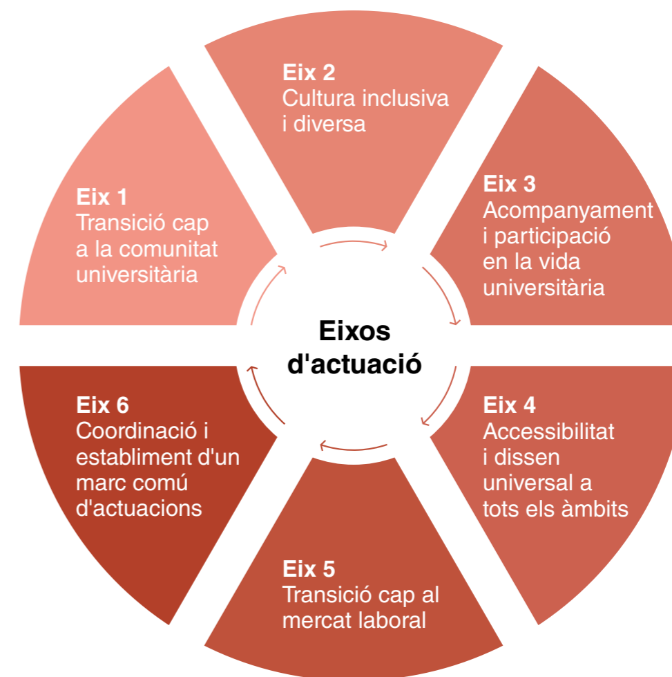
Figura 2. Eixos d'actuació del Pla de Diversitat (Font: PIDUC)

Per a cada acció proposada, s'especifica el col·lectiu al qual s'adreça, el responsable de la seva execució i el calendari previst per a la seva implementació. Aquesta metodologia assegura un seguiment eficient i una assignació clara de responsabilitats, elements fonamentals per transformar la diversitat en una realitat tangible i efectiva a la Universitat.