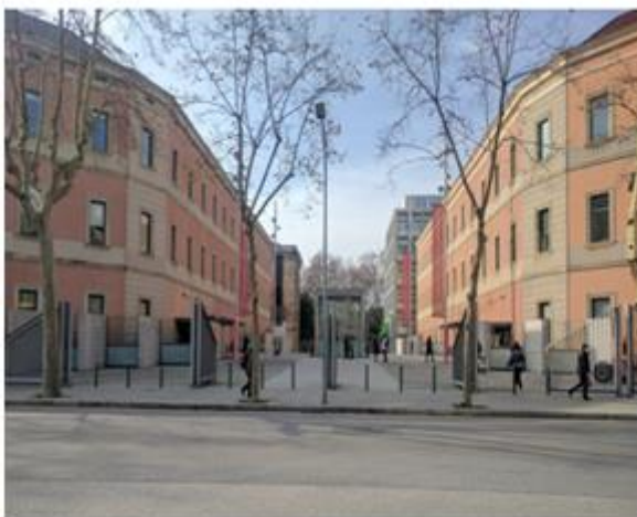
Entrada principal del campus (c/Ramon Trias Fargas amb c/doctor Trueta)

Per a accedir-hi heu d'entrar a través de l'entrada principal del campus (c/Ramon Trias Fargas amb c/doctor Trueta), creuar la plaça i girar a la dreta al carreró que trobareu entre dos edificis. Després continueu recte fins que trobeu una porta de vidre a l'edifici de l'esquerra amb un cartell vermell on posa "Edifici Mercè Rodoreda 23/24".