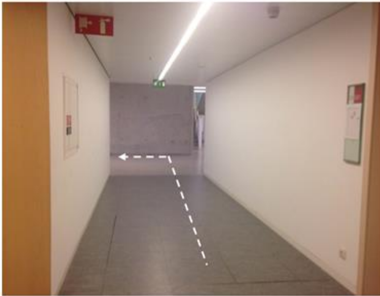
Sortida de l'ascensor

El Laboratori de Neurociències està a la Planta (-1) . Quan entreu a l'edifici trobareu dos ascensors. Quan sortiu de l'ascensor aneu cap a l'esquerra i quan pugueu gireu a l'esquerra i trobareu la porta del laboratori.