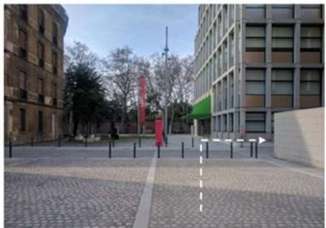
Plaça i carreró