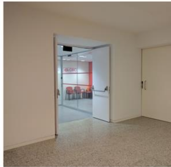
Entrada del laboratori

Si teniu dificultats per trobar el lloc, ens podeu trucar al telèfon 93 542 25 64.