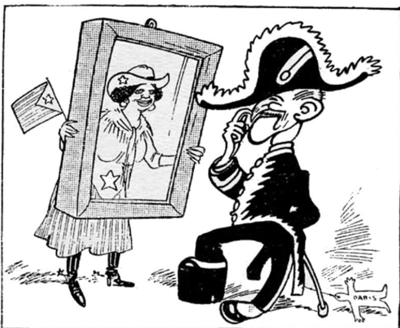
L'ESPILL DE CUBA

He aquí reproducida la bandera que el ministro de la Gobernación exhibió ayer en el Congreso. Para aquellos de nuestras lectores no versados en el arte del Blason, diremos que el punteado de las franjas representa el oro (amarillo) y las líneas verticales los gules (rojo); en el jítón o triángulo de la izquierda se indica con las líneas horizontales el azul (azul), y la estrella de fondo liso que campea en él es de metal de plata (blanco). Y para los que no están al corriente de las símbolos, hay que añadir que las cuatro bandas rojas significan las barras catalenas y que la estrella solitaria, adoptada también por los cubanos cuando guerrearban por la independencia, es el emblema del separatismo.