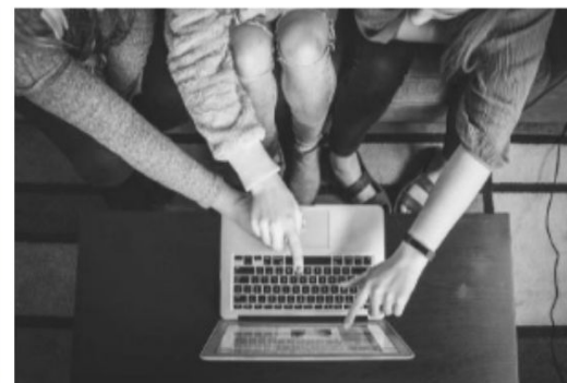
Mínor en Narrativa i Creació Digital

INFORMACIÓ GENERAL: https://www.upf.edu/web/minors