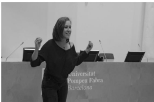
Mínor en Oratòria