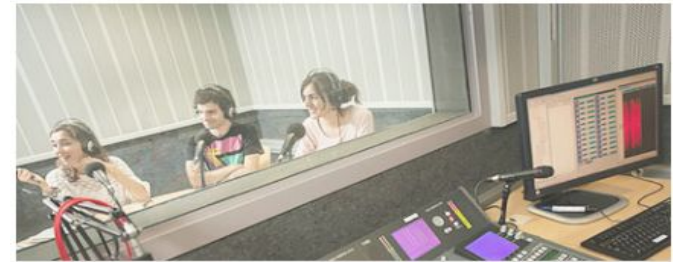
Altres cursos Graus Comunicació (continuïtat en els estudis)

Dates de matrícula: entre el 25 i 27 de juliol