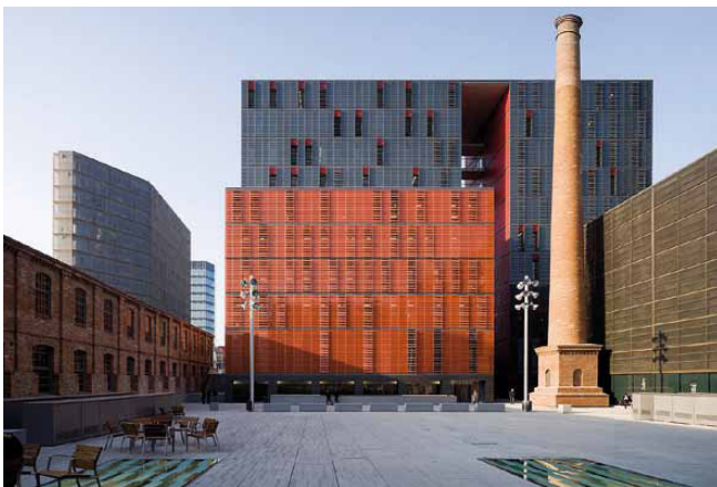
Fotografía de los Edificios Roc Boronat (centro), la Nau (izq.) y Tallers (dcha.) del campus de la Comunicación-Poblenou.

El Departamento de Comunicación y la Facultad de Comunicación están situados en el Campus del Poblenou de la UPF, inaugurado el año 2008, que permite una docencia y una investigación de la máxima calidad gracias, entre otros, a unas modernas instalaciones. El Campus del Poblenou está situado en el distrito 22@, un barrio en expansión destinado a reunir las empresas e instituciones vanguardistas en tecnología y comunicación de la ciudad de Barcelona.