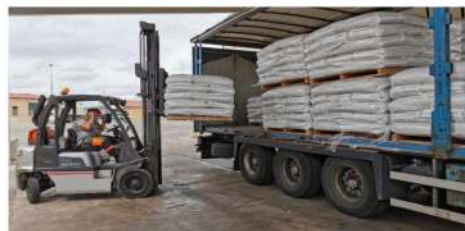
Camión con pienso para ganaderos (EUPSO) - Archivo