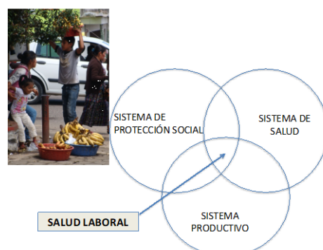
Figura 1. Relación de la salud laboral respecto a los sistemas de Seguridad Social, Sistema Nacional de Salud y Sistema Productivo.

El ámbito de investigación y políticas en salud laboral, tal como lo abordamos en esta asignatura, lo situamos (figura 1) en el espacio de intersección entre el sistema productivo, los sistemas de protección social y los sistemas de salud.