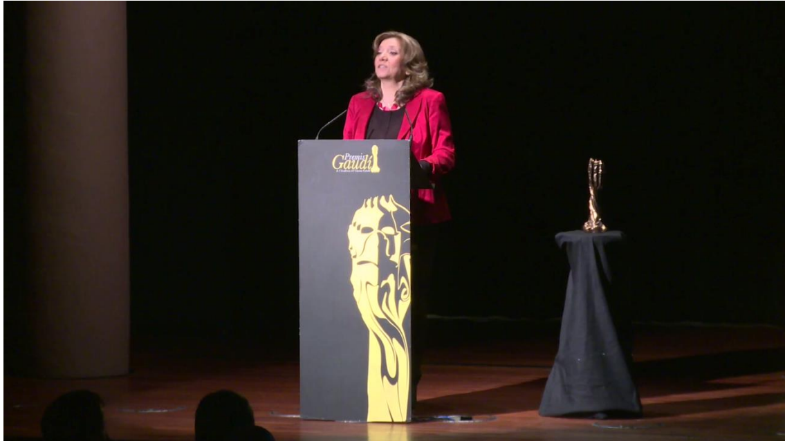
Presentació d'Isona Passola, Presidenta de l'Acadèmia del Cinema Català.