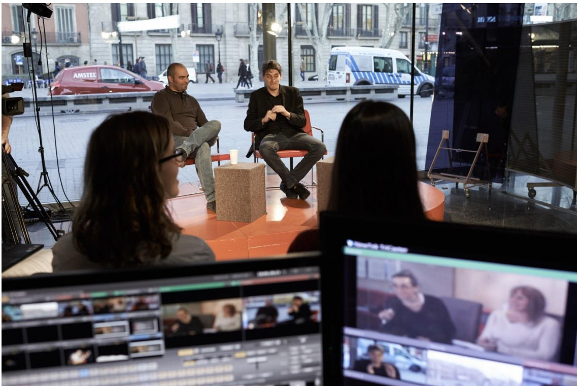
MÓN PETIT [GAUDÍ millor documental, nominació millor direcció de producció] Oriol Maymó (productor, Corte y Confección) i Marcel Barrena (director, guionista, productor, Umbilical Produccions)