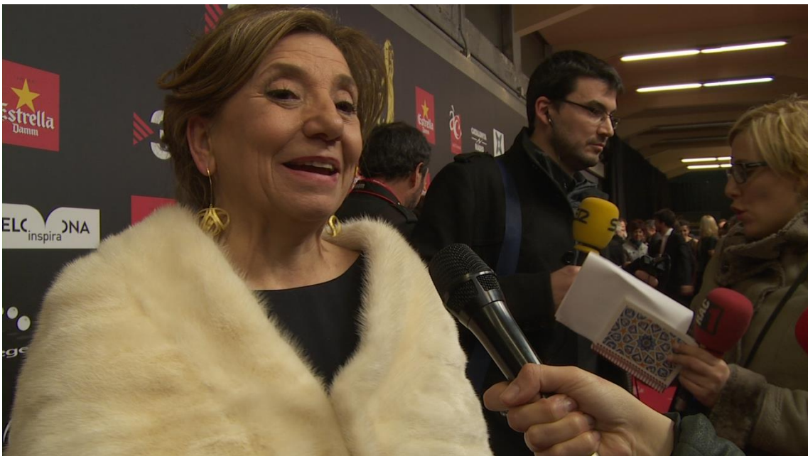
Isona Passola, Presidenta de l'Acadèmia del Cinema Català.