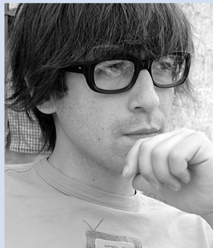
LUIS PIEDRAHITA Humorista. Premio Nacional de Magia