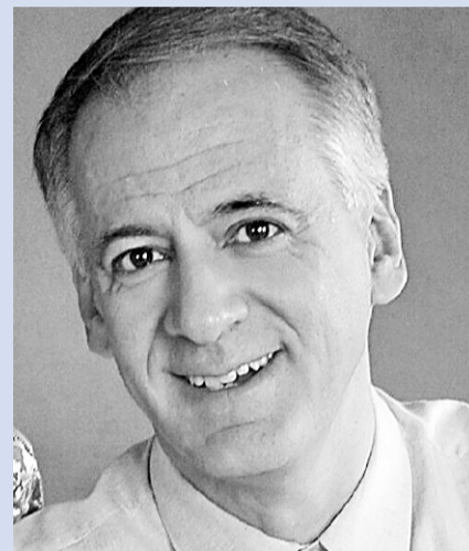
IGNACIO CEMBRERO Corresponsal "El País" Norte de África