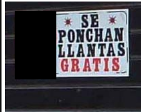
Coyoacán, México DF, 2004