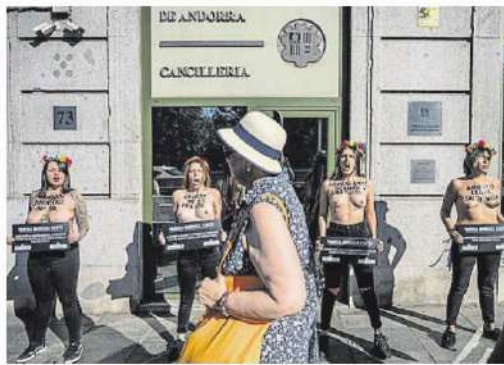
Protesta de Femen davant de l'ambaixada a Madrid

Una entitat feminista andorrana ajuda a sufragar els costos de l'operació abortiva a Espanya