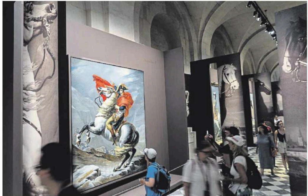
Una imatge de Napoleó en una exposició sobre cavalls a Versalles, que acull les competicions olímpiques d'hípica

Tot i això, des del general De Gaulle, primer president de la V