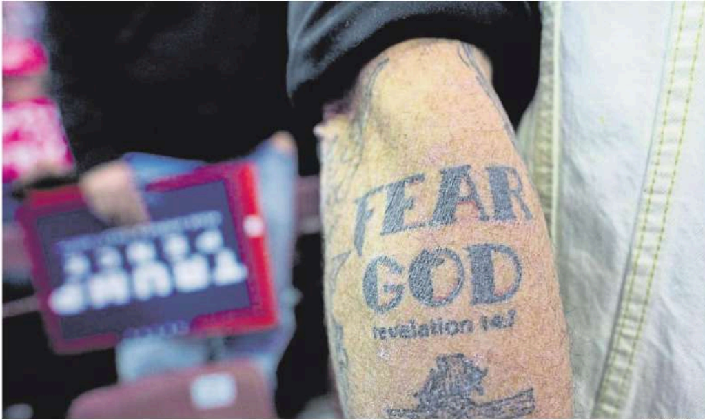
Un seguidor de Donald Trump amb un tatuatge al braç del lema "Tingueu por de Déu", segons una imatge recollida en un acte del 2016