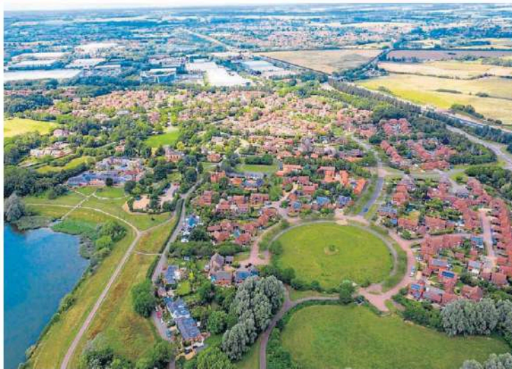
Imatge aèria de Milton Keynes, ciutat aixecada el 1967 i la més reeixida de les de nova planta.