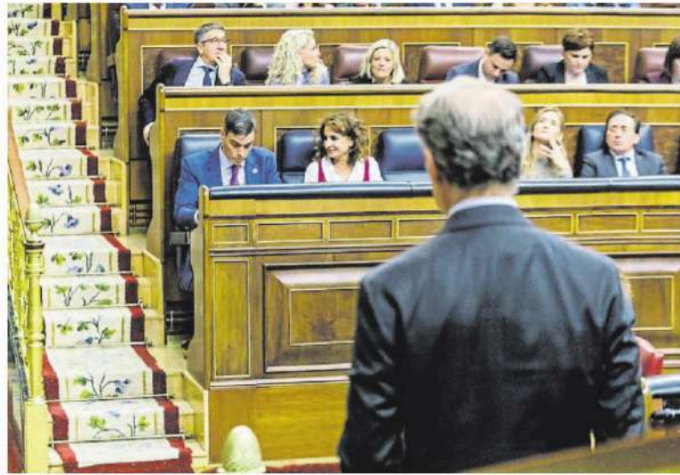
Alberto Núñez Feijóo adreçant-se a Pedro Sánchez en un ple del Congrés al novembre

Es el dret a la tutela judicial efectiva, que sempre protegeix el Tribunal Constitucional. Els jutges no poden valorar la intenció de qui denuncia, només si els fets que es denuncien poden constituir un delicte i si hi ha sospites fonamentades per dirigir les diligències cap a alguna persona. I han de practicar una mínima in-