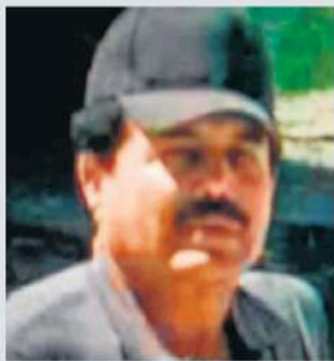
Imatge policial d'Ismael el Mayo Zambada García. ere