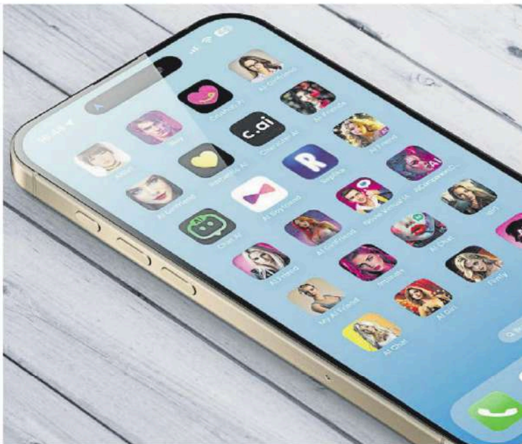
Un mòbil amb algunes de les opcions disponibles d'apps d'amistat i festeig virtuals per IA

La història recorda la de la pel·lícula Her , en la qual Joaquin Phoenix s'enamora del sistema operatiu d'un ordinador encarnat per Scarlett Johansson. També posa en el focus les múltiples advertències que psicòlegs, sociòlegs i altres experts