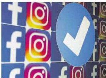
Les xarxes, un impacte per als joves

La foguera mediàtica qui s'atreveix a discrepar i boicotegen violentament els actes de presentació de llibres seriosos i ben informats que mostren els punts febles d'aquest moviment pretesament alliberador. Però també hi ha víctimes innocents d'aquests nous totalitarismes "tous", de manera silenciosa i sense traçabilitat. Els totalitarismes forts del segle XX enviaven milions de joves a morir directament als camps de batalla, o als "lager" o "gulag" de torn. Els nous totalitarismes malden per configurar les ments a través de les xarxes socials i de l'adoctrinament que ja es fa en algunes escoles. L'impacte sobre els adolescents, en fase de recerca de la identitat i la manera pròpia de ser al món, és molt gran. Al món anglosaxó la petició de canvi de sexe ha experimentat un creixement exponencial des de l'aparició d'Instagram. A casa nostra podrien ser una de les causes de l'augment inquietant de suïcidis d'adolescents. Si vàrem ser crítics amb els totalitarismes forts del segle XX, no ho hauríem de ser menys amb els totalitarismes tous del segle XXI.