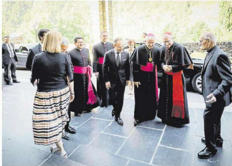
Al centre, Xavier Espot (amb corbata), amb Joan-Enric Vives (al mig) i Pietro Parolin

Al setembre, ni més ni menys que el secretari d'Estat del Vaticà, Pietro Parolin, va visitar el principat. Formalment hi va anar per la festa nacional d'Andorra, el Dia de la Mare de Déu de Meritxell (8 de setembre), però fonts properes al Govern d'Andorra apunten que aquella visita va suposar l'aval definitiu per abordar la qüestió. Davant els mitjans, Parolin va admetre que la de l'avortament "és una qüestió molt delicada