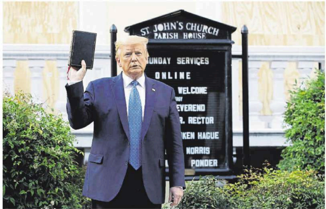
L'ús per Trump de la Bíblia ja va causar consternació el 2020 quan, sent president, es va fotografiar amb el llibre en un acte polític

Sota l'esperit d'aquestes dades, ho veuen així al Daily Beast : "Hi ha cap millor manera de celebrar la glòria de la resurrecció que ajudant un sospitós criminal, acusat de desenes de càrrecs, a pagar els seus honoraris legals?".