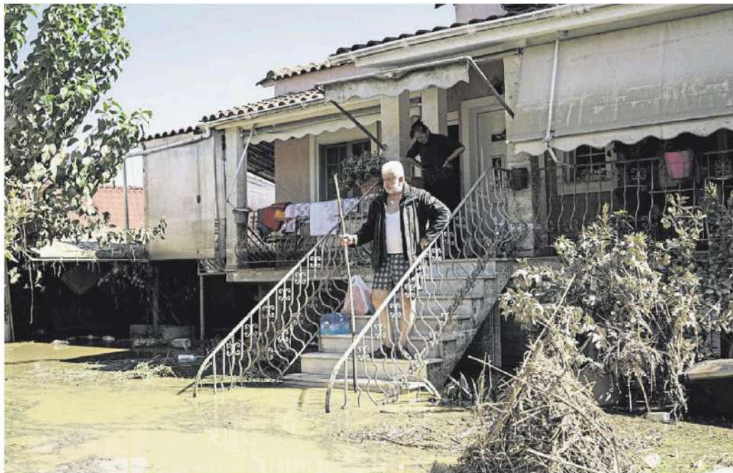
Dos veïns de Metamòrfosi observant els efectes de la tempesta Daniel, que va assolir la regió el setembre del 2023

SERGIO AIRES MACHADO VERONICA RIDOLFO AVVISATI Barcelona