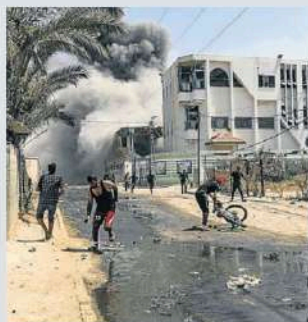
Palestins corrent durant l'atac israelià a l'escola Khadija.

Israel també va atacar ahir l'escola Khadija de Deiral-Balah, al centre de l'enclavament, on van morir 30 persones i un centenar van resultar ferides, segons les autoritats sanitàries gazatines. Entre les víctimes hi ha 15 criatures i 8 dones. A l'escola es refugiaven unes 4.000 persones provinents d'altres parts de la Franja.