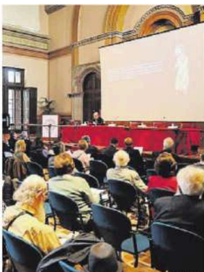
Assistents al congrés de l'AUSP

En el seu cas, Arri buscava distingir el Pare i el Fill, però per això presentava el Fill com a subordinat al Pare, com una criatura divina, un déu intermediari, creat