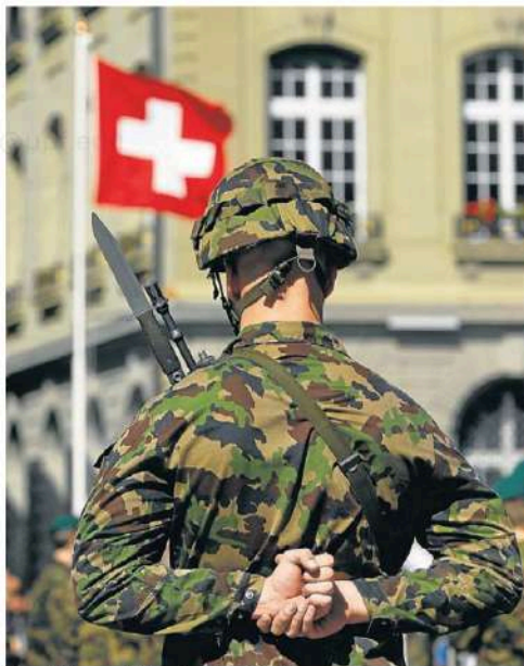
Un soldat davant d'una bandera de Suïssa.

Quan Rússia es va annexionar la península de Crimea l'any 2014, Suïssa no es va alinear amb la Unió Europea i els Estats Units en l'aplicació de sancions al règim rus. En canvi, amb l'atac rus sobre Ucraïna el febrer del 2022, el país helvètic sí que va sancionar Rússia. Algunes veus crítiques, inclos el Kremlin, van assegurar que la imposició de sancions representava la fi de la històrica neutralitat suïssa. Però el fet és que Berna ja havia aplicat sancions