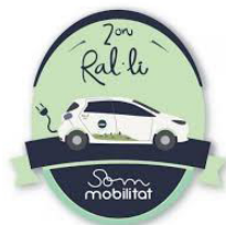
Figura 1: Dissenys Som Hackathon 2019 i 2on Ral·li Som Mobilitat.