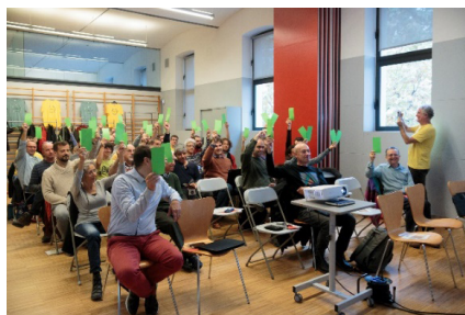
Figura 3: Assemblea ordinària.