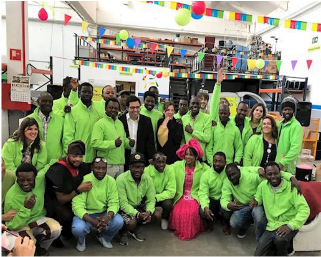
Figura 1. Treballadors de la cooperativa durant un taller de reparació de petits electrodomèstics.