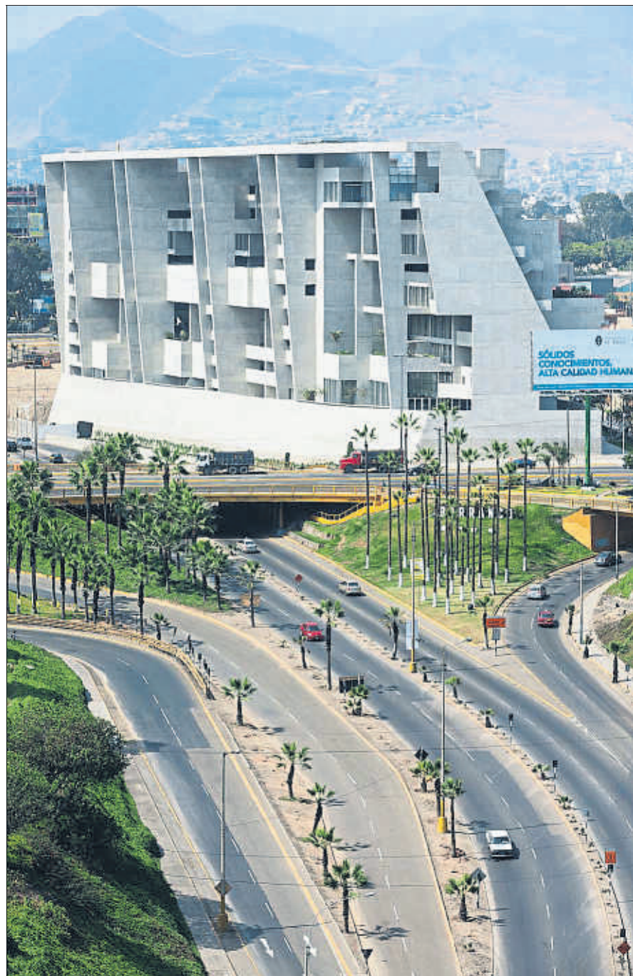
Campus universitario UTEC, en Lima

@vintmilocells Gabriel Ventura Poeta El meu cervell ha esdevingut una franquícia de l'Overlook Hotel i n'he perdut el fullet psicòtic informatiu. Tot són obstacles, impediments i forclusions. I suor, i suor, i suor.