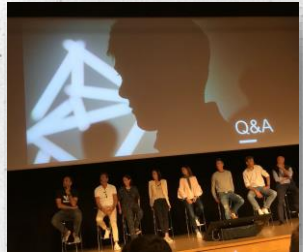
ALL EMPLOYEE MEETINGS