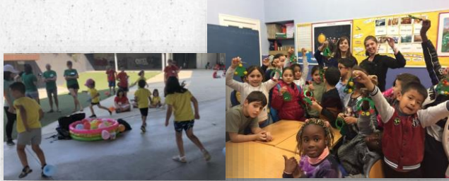
Actividades de voluntariado