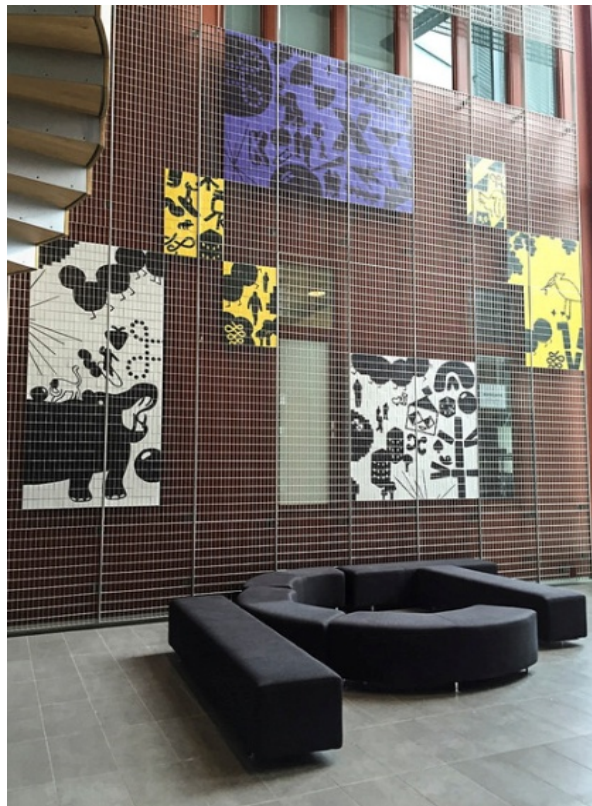
Espais multifuncionals per estudiants