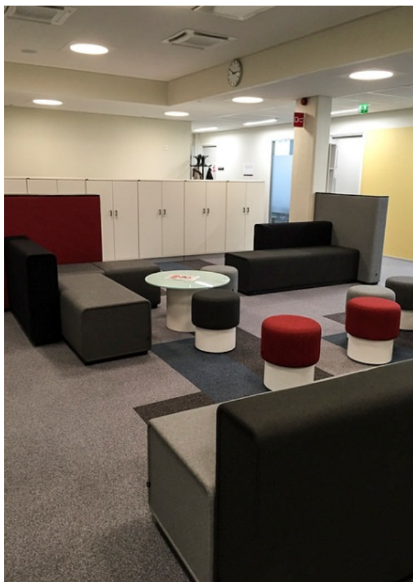
Espais multifuncionals per estudiants