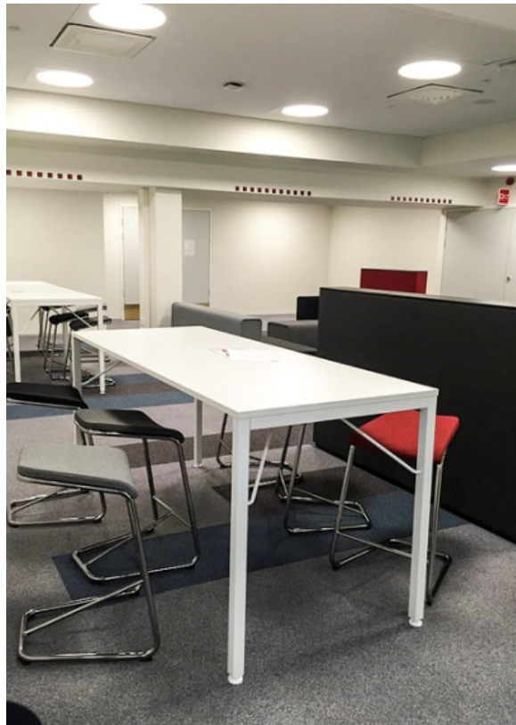
Espais comuns per a reunions o treball en equip