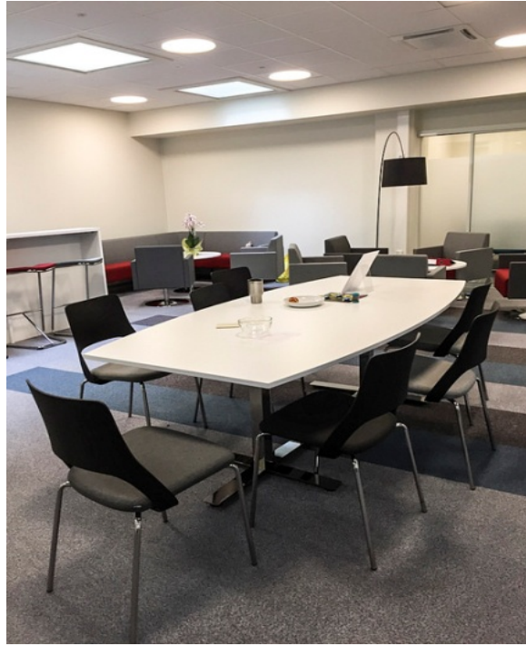
Espais comuns per a reunions o treball en equip