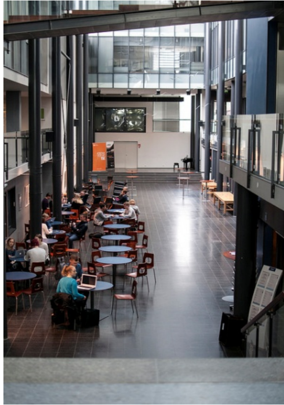
Espais multifuncionals per estudiants