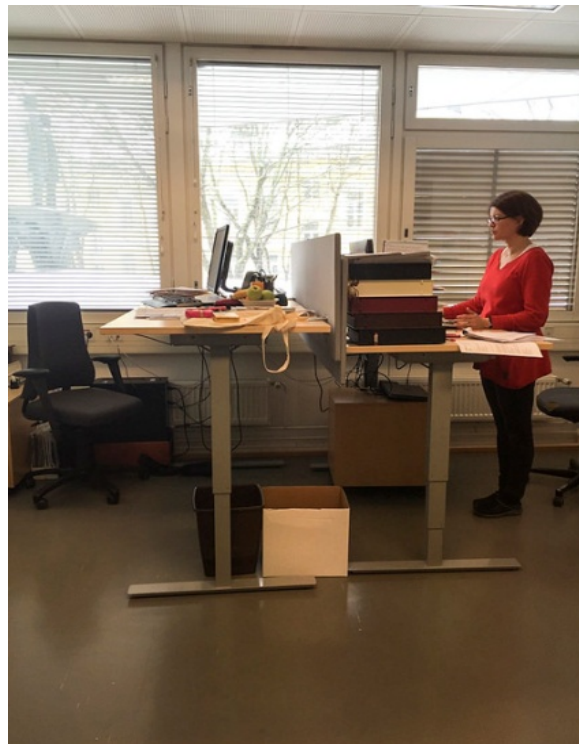
Taules regulables en alçada per treballar drets o asseguts