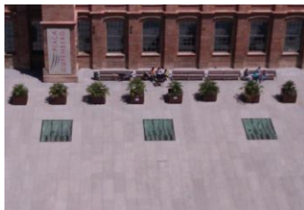
PLAÇA GUTENBERG (La Fàbrica i Roc Boronat)