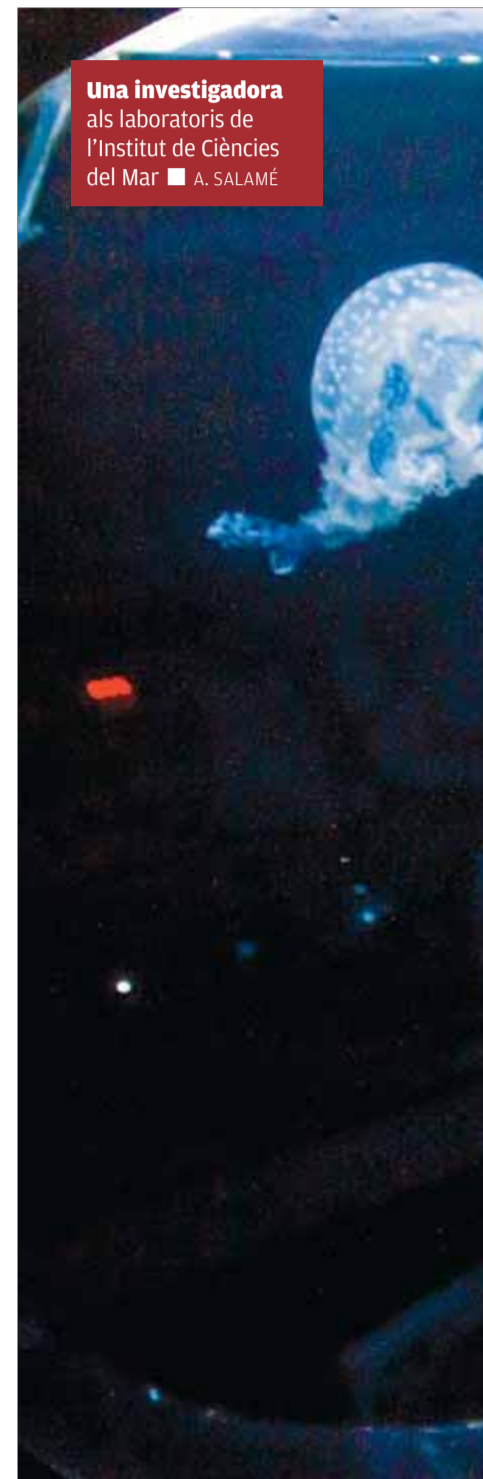
Una investigadora als laboratoris de l'Institut de Ciències del Mar

La universitat catalana és bona; és molt bona en estàndards espanyols i fins i tot europeus; no ho és globalment. N'hem d'estar satisfets, però l'hem de millorar, i els reptes no són senzills. Dissortadament, la universitat ha viscut massa temps aïllada de la societat i dels seus reptes, i això l'ha fet poc competitiva i anquilosada. Hi ha aspectes que és peremptori que canviï, cal que se la faci canviar, des de petiteses fins al mateix concepte d'entitat, més enllà del bé i del mal. La nostra universitat és poc competitiva i li calen canvis estructurals fonamentals, des de la governança fins al model de gestió i funcionament intern, que massa vegades utilitza i reivindica models assemblearis carregats d'interessos no justificats ni acceptables socialment. Per exemple, la universitat no hauria de tenir al seu servei qui no la serveix: sabem que prop del 50% dels professors universitaris o no fan recerca o la fan de manera marginal; això és un ca-