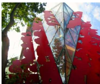
Edifici Mercè Rodoreda. (ja construït)