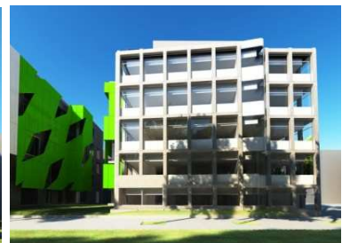
Edifici II. Projectió Superfície construïda: 4.268 m 2 Inversió prevista: 14 milions €

En segon lloc, convé destacar les actuacions destinades a la promoció i a la captació de talent internacional , tant les impulsades per la mateixa universitat, amb mires cap als projectes europeus i per a les quals s'ha aconseguit, entre altres, finançament de la Comissió Europea (Programa COFUND del 7è Programa Marc de la UE) (B3) com les beques de mobilitat impulsades, essencialment, entre les universitats de l'A4U (B4).