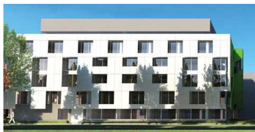
Edifici I. Projectió. Superfície construïda: 8.685 m 2 Inversió prevista: 15,2 milions €