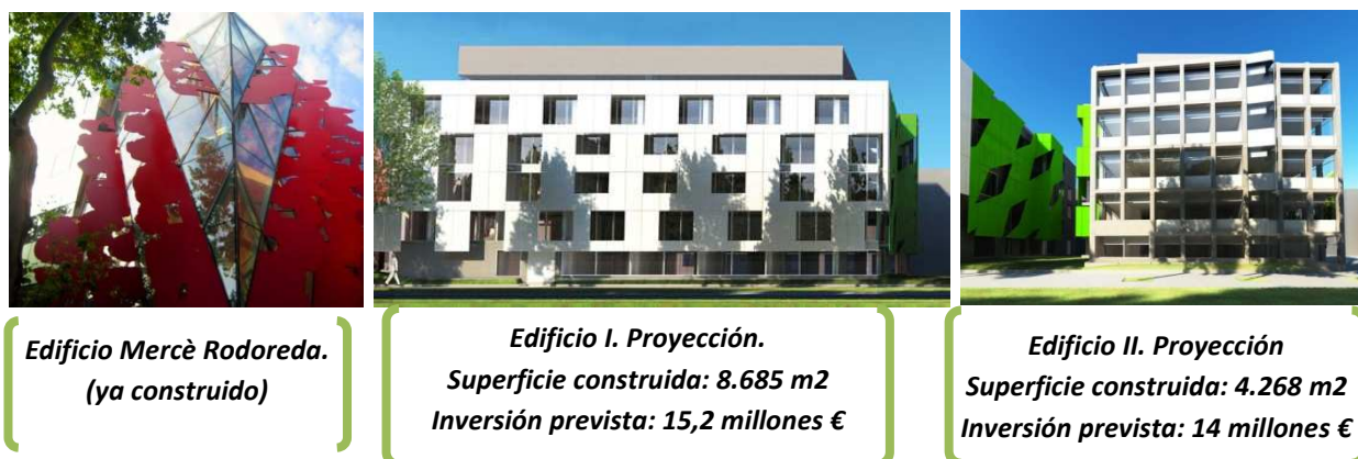
Figura II. Parque de Investigación UPF

En segundo lugar, conviene destacar las actuaciones destinadas a la promoción y a la captación de talento internacional , tanto las impulsadas por la propia universidad, con miras hacia los proyectos europeos y para las que se ha logrado, entre otras, financiación de la Comisión Europea (Programa Cofund del 7º Programa Marco de la UE) (B3) como las becas de movilidad impulsadas, esencialmente, entre las universidades de la A4U (B4)