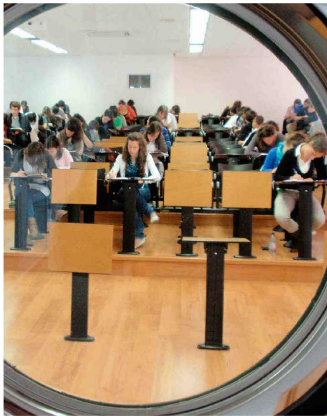
UNIVERSIDAD AUTÓNOMA DE MADRID

La carrera se complementa con el Diploma Business and Law. Además, puede combinarse con Relaciones Internacionales y Negocios.