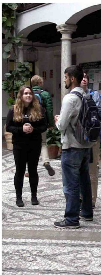
UNIVERSIDAD DE GRANADA

Además de una enseñanza de calidad, ha desarrollado interesantes líneas de investigación en el ámbito propio del Trabajo Social.