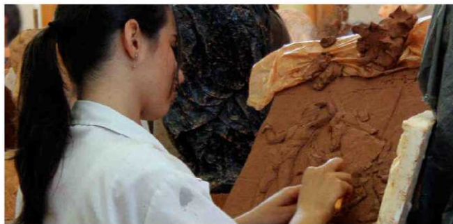
UNIVERSIDAD COMPLUTENSE DE MADRID

En lo que se refiere al lugar en el que les gustaría desarrollar su formación universitaria, la mitad de los encuestados en UNITOUR quiere estudiar cerca del domicilio familiar, en su propia provincia o Comunidad Autónoma, mientras que un 34% lo hará en cualquier ciudad de España y un 13% se aventurará a ir al extranjero. Sin embargo, cuando se les pregunta por sus opciones laborales, un tercio de los consultados se iría a vivir donde encontrase trabajo y directamente un 23% buscaría un puesto internacional. Por ello, el dominio de, al menos, una lengua extranjera es un requisito que cada vez es más necesario a la hora de encontrar un empleo (un tercio de las ofertas de trabajo ya lo exige). Cada vez más, las empresas apuestan por internacionalizarse y exportar sus productos y servicios dentro de un mundo dominado por la globalización, que controla las relaciones comerciales, productivas e interpersonales y las comunicaciones.