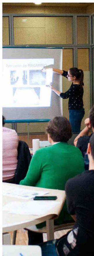
UNIVERSIDAD COMPLUTENSE DE MADRID

Altamente demanda en los programas erasmus, la facultad cuenta con más de 400 alumnos extranjeros. Oferta tres itinerarios.