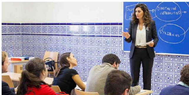
UNIVERSIDAD PONTIFICIA DE COMILLAS