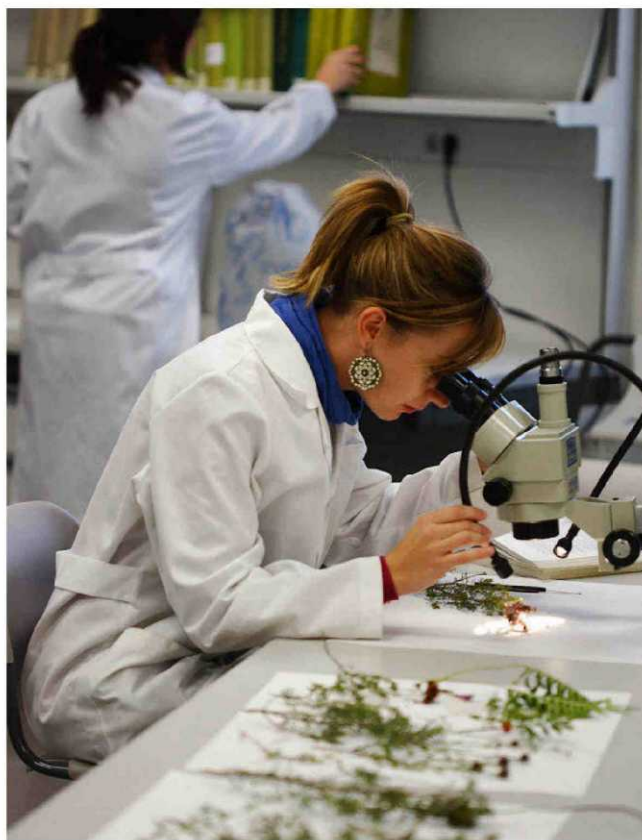
UNIVERSIDAD POLITÉCNICA DE VALENCIA

Su grado se imparte (y está respaldado) en la Escuela Técnica Superior de Ingeniería Agronómica, Alimentaria y de Biosistemas.