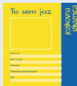
PEL eslovaco adolescentes

Descripción de conocimientos lingüísticos y de habilidades. Reflexión sobre el aprendizaje. Formulación de planes de aprendizaje