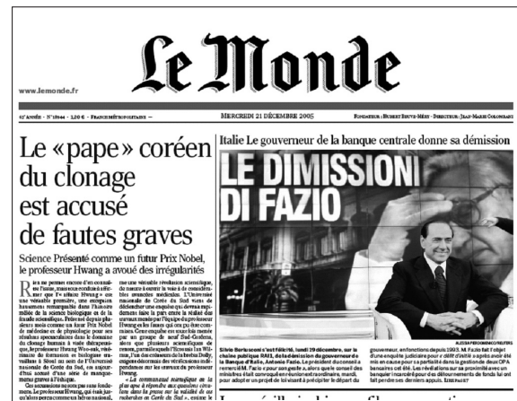
El fraude del profesor Hwang fue portada en todo el mundo

No es nuestra pretensión abordar los detalles científicos del caso. Son suficientemente conocidos y han sido ampliamente aireados y discutidos en múltiples foros científicos, incluso en los medios de comunicación no especializados. Parece claro que si un equipo científico decide promover un fraude de estas características y lo fabrica a conciencia resulta muy difícil detectarlo por parte de la revista científica a la que se somete su publicación. Sólo si se aplicara la comprobación del experimento por replicación –que en teoría debería ser la base de la validación antes de su publicación– se podría alcanzar la certeza o no de que la investigación realizada cumple los requisitos del método científico. Pero, obviamente, ello resulta imposible en la mayoría de los casos.