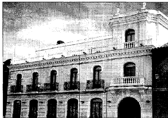
Fachada principal del edificio del CIFF en Alcalá de Henares (Madrid).