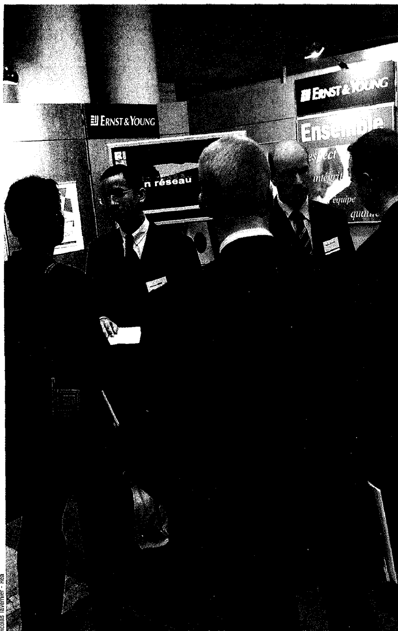
Nicolas Tavernier - Réa