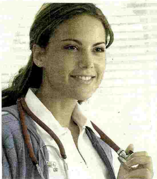
La rama sanitaria ha crecido en los últimos años

Las profesiones relacionadas con las nuevas tecnologías y, sobre todo, con la Red, se imponen con fuerza desde hace algunos años y son las que tienen un panorama más amplio. Cualquier empresa que se precie tiene que estar en Internet. Y tan importante es su volumen de negocio como saber venderse y mantener su imagen