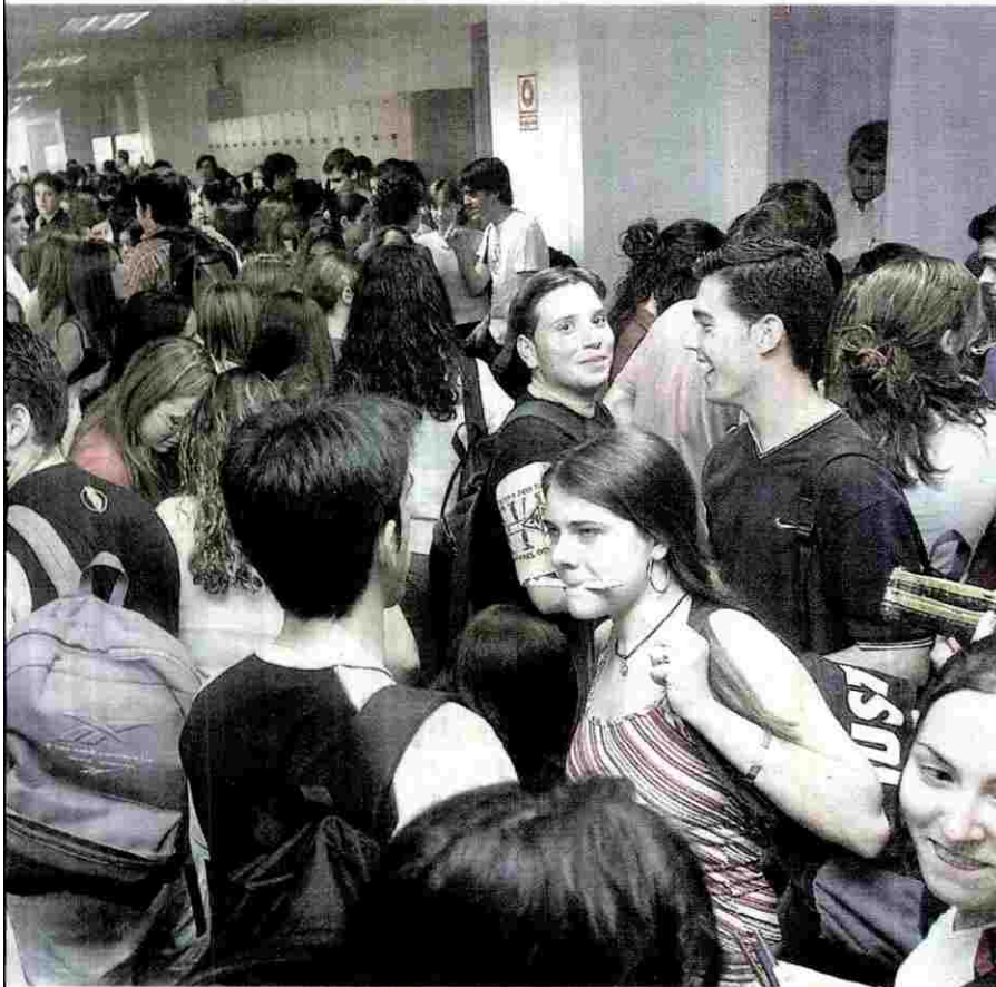
La universidad es un buen trampolín para la vida laboral que llegará tras los estudios

Los especialistas en energías «limpias» serán las locomotoras de la economía