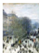
5.13 Des Capucines per Monet