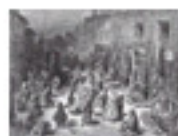
5.2 Londres a un gravat de Doré