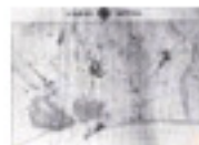
5.22 El pla de Barcelona abans del Pla Cerdà