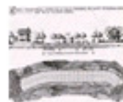
5.28 La ciutat lineal d'Arturo Soria