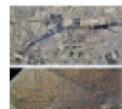
5.25 L'eixample Cerdà comparat amb el centre de París