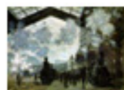
5.6 L'estació de St. Lazare per Monet