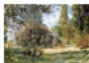
5.12 El parc Monceau per Monet