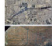
5.25 L'eixample Cerdà comparat amb el centre de París