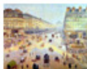
5.21 L'Avinguda de l'òpera per Pissarro