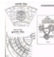
5.29 La ciutat jardí de Howard