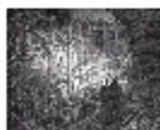
5.1 Londres a un gravat de Doré