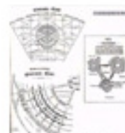
5.29 La ciutat jardí de Howard