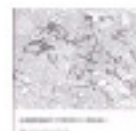
5.19 Les xarxes de comunicació sota la 2ª República i el 2º imperio