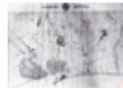
5.22 El pla de Barcelona abans del Pla Cerdà