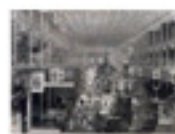
5.9 The Great Exhibition