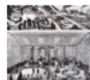
5.15 Un familisteri segons un gravat de Godin