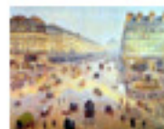
5.21 L'Avinguda de l'òpera per Pissarro