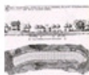
5.28 La ciutat lineal d'Arturo Soria