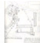
2.4 L'àgora d'Atenas a finals de l'època helenística