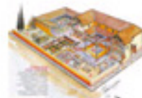
2.13 Una 'domus'