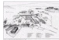
2.3 L' Àgora d'Atenas al segle V a.C.