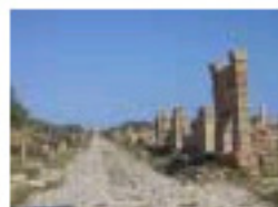
2.26 Leptis Magna