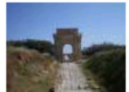
2.25 Leptis Magna