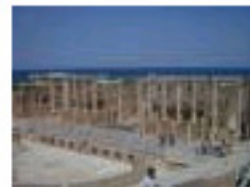
2.28 Leptis mana