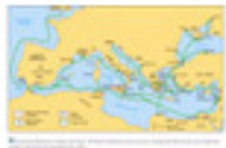
2.1 Colònies gregues i fenícies