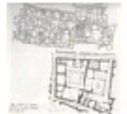
2.5 Les 'insulae' de Delos