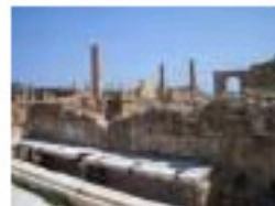
2.27 Leptis Magna