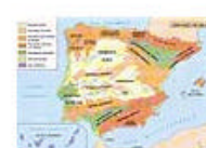
3.5 España: unidades de relieve