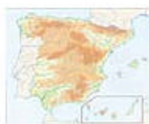
3.1 España: mapa físico en blanco