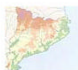
3.3 Cataluña. Mapa físico en blanco