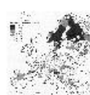
3.14 Porcentaje de territorios forestales