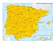
3.7 Pluviometría: precipitación máxima en 24 horas.