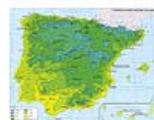
3.9 Clima: temperaturas medias en enero