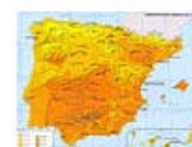
3.10 Clima: temperaturas medias en julio