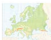
3.2 Europa: mapa físico en blanco