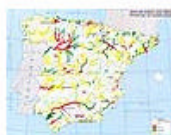
3.8 Pluviometría: zonas de riesgo potencial de inundaciones