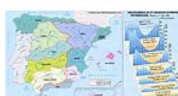
3.13 Cuencas hidrográficas y gráficas de estiaje