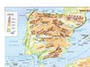
3.4 España física: altimetría e hidrografía