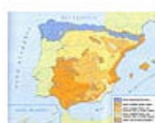
3.12 Los climas de España