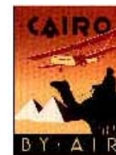
4.9 Cartel "art