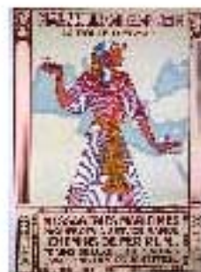
4.2 Publicidad de las Messageries Maritimes