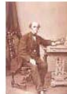
4.3 Thomas Cook