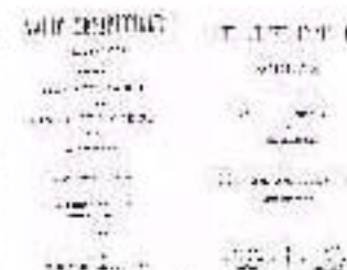
4.7 Dos ediciones de