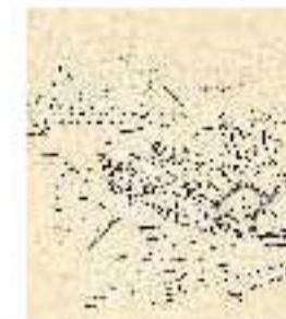
4.4 Dibujo de Olaguer Junyent