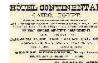
4.5 Publicidad del Hotel Continental del Cairo