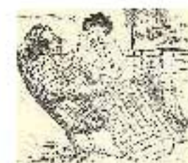
4.14 Dibujo de Olaguer Junyent