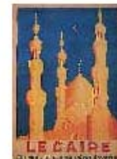
4.8 Cartel turístico