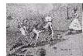
4.13 A stopping place on the Nile