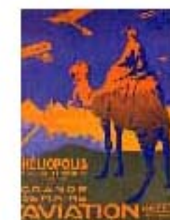
4.10 Cartel turístico