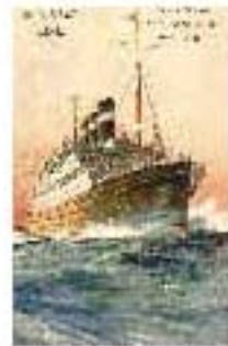
4.1 Publicidad de la Red Star Line