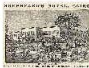
4.6 Publicidad del