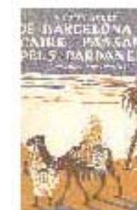
4.15 Portada de un libro de V.Coma Soley