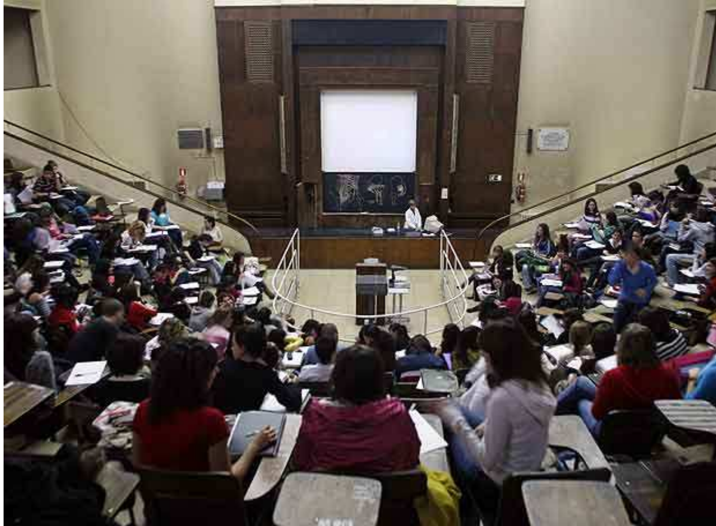
Aula de la Facultat de Medicina (Universidad Complutense, 2008)