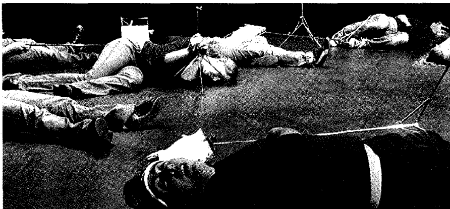
Lectura dramatitzada de la Universitat Jaume I de Castelló.