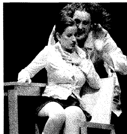
¡Gracias, querida!, de la Universitat Miguel Hernández.